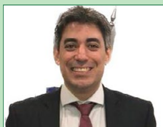
Caio Rothsahl Botelho Promotor de Justiça do MPSC