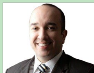
Vinícius Secco Zoponi Promotor de Justiça do MPSC